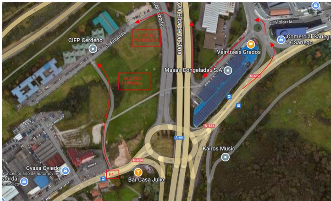
Acceso al CIFP CERDEÑO

El acceso peatonal solo permite su tránsito a pie.