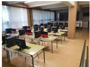
Oficina Técnica 1 (OT1)