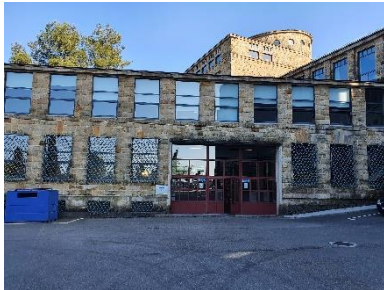
Plaza y entrada exterior