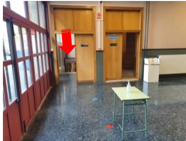
Hall distribuidor Bajada plata sótano puerta izquierda