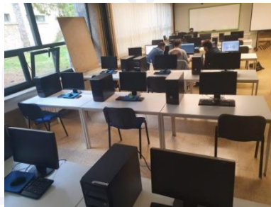
Oficina Técnica 2 (OT2)