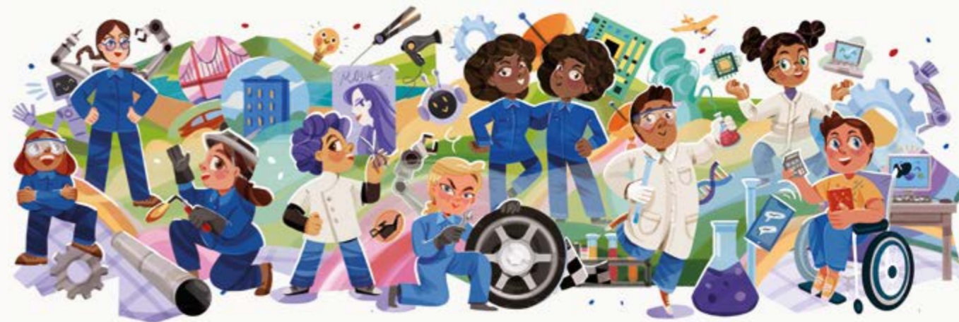
Mural de "el cole de los oficios" ↑