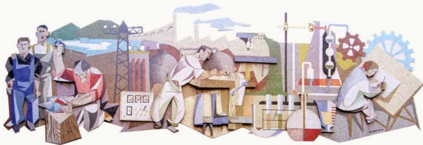
↑ Mural realizado por Suco-Sánchez Luis en 1960, y que ha servido como inspiración para este libro.