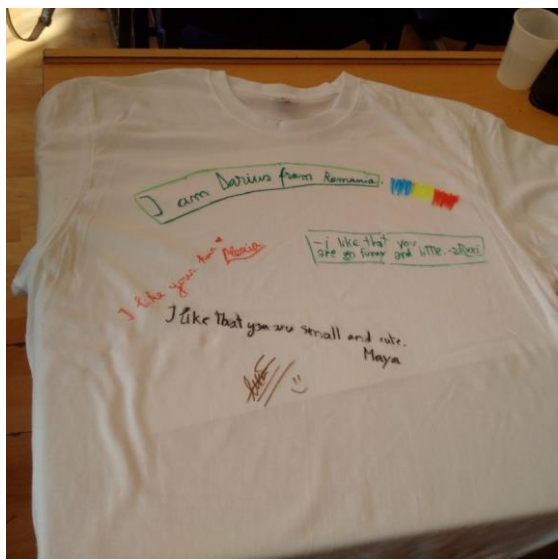
Las actividades de evaluación del proyecto para profesores y alumnos y la despedida oficial.