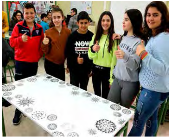
“Mesas mentoras” para el aula Espacio por la Igualdad. 1º ESO E. Plástica y Visual.