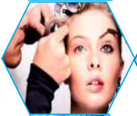
IMAGEN PERSONAL 6 Grupos