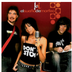
Esta soy yo El sueño de Morfeo.

Tras la audición de la canción “Esta soy yo” de El sueño de Morfeo se propone al alumnado analizar la letra. El tutor o la tutora orienta la tarea con preguntas y sugerencias.