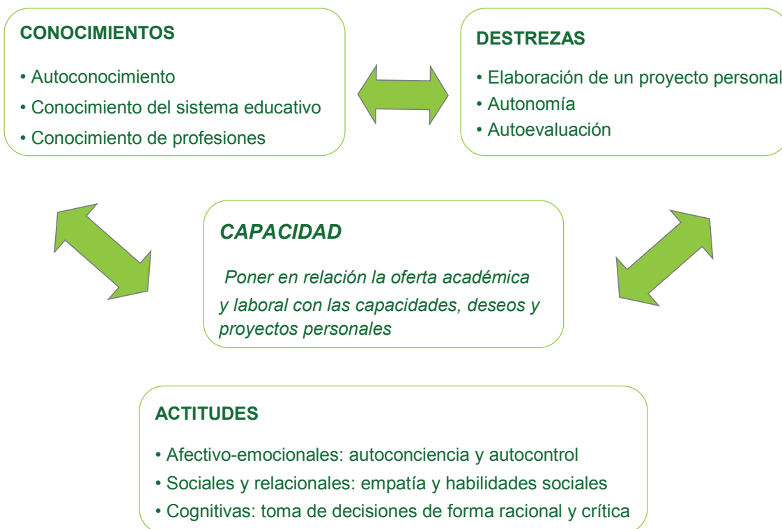
Cuadro 4. Contenidos que definen la competencia para aprender a tomar decisiones sobre el futuro académico y profesional.

Definido el marco y los contenidos del programa (qué enseñar) es necesario establecer las líneas que permitan su desarrollo desde el enfoque de la educación por competencias (cómo enseñar) y es así como se aborda la elección de unas bases sólidas que definan la metodología de trabajo.