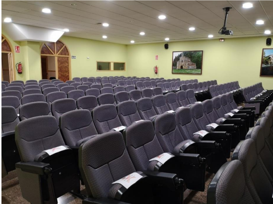
Salón de actos del centro

Del mismo modo, la presentación se llevará a cabo en el salón de actos del centro, con capacidad suficiente y con medidas anticovid y ventilación forzada para acoger a todos los candidatos.