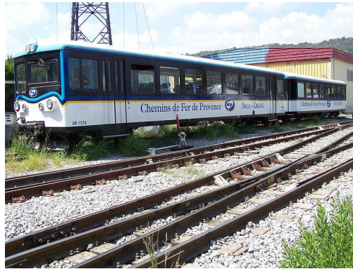
Wikimedia Commons, Eric Coffinet